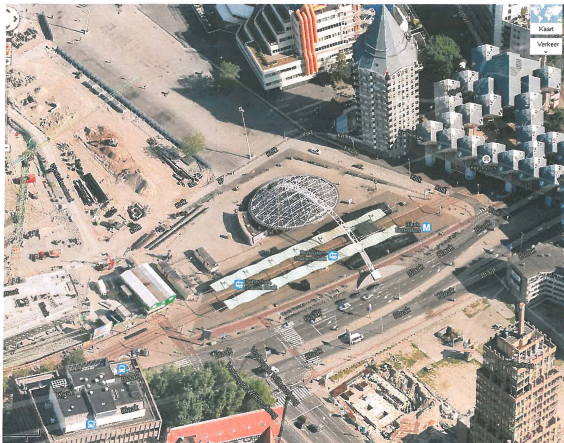
Figuur 1: Een beeld van de complexe omgeving bij station Blaak. Ondertussen zijn aan de locatie toegevoegd: Kantoorgebouw Loyens en Loeff B.V. (links onder) en de Markthal (links midden).

De locatie bevindt zich midden in een zeer druk, complex infrastructureel knooppunt met trams, metro, treinen, auto's, fietsers en voetgangers. Tegelijkertijd wordt er 2 maal per week de grootste markt van Nederland gehouden. De laatste jaren is veel geïnvesteerd om deze omgeving te transformeren naar een hoogwaardig binnenstedelijk gebied van internationale allure, waarbij de nieuwe Markthal (direct tegenover het fietsplein!) al voor de opening een icoon is. De omgeving van het projectgebieden heeft een architectonische diversiteit die zijn weerga niet kent. Deze kwaliteit en binnenkort uit te voeren kwaliteitsslag in de openbare ruimte wordt zeker ook beoogd met het nieuwe fietsplein en de kiosk.